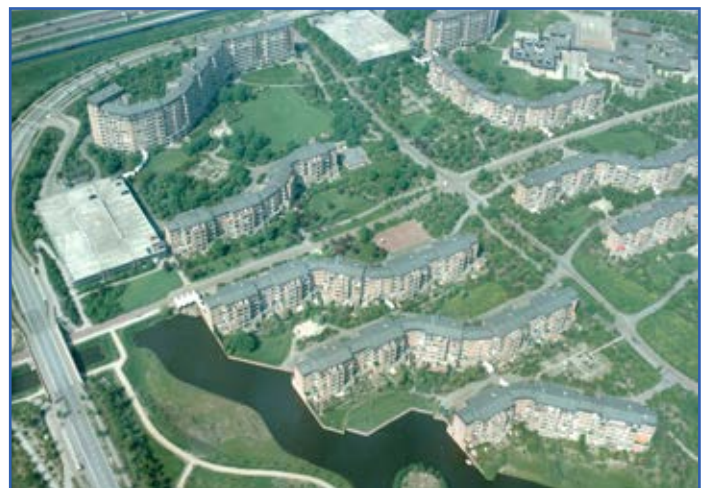
Luchtfoto Nellestein 1980

In de komende maanden houden we bewoners via de BVN-website op de hoogte van de plannen. Ook oproepen voor concrete bijdragen aan de jubileumuitgave zullen we via die weg verspreiden.