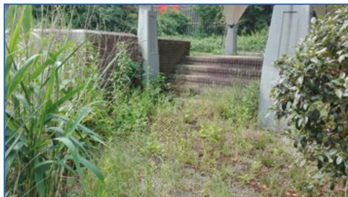
Visplek Leerdamhof voor het opknappen