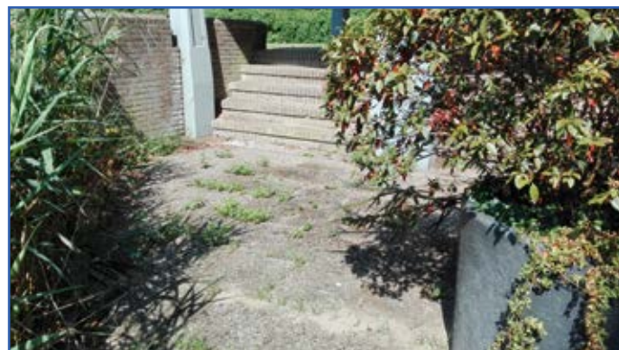
Visplek Leerdamhof na het opknappen

De Commissie Woonomgeving (CWO) is het hele jaar actief om beschadigingen e.d. in de openbare ruimte van Nellestein te signaleren en aan te kaarten bij Stadsdeel Zuidoost.