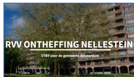
Voorpagina rapport RVV-beleid Nellestein STBY